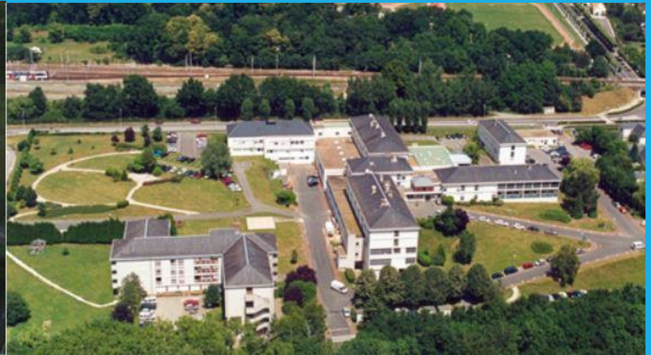
site de DOURDAN

Une équipe pluridisciplinaire au services des patients porteurs d'une pathologie tumorale