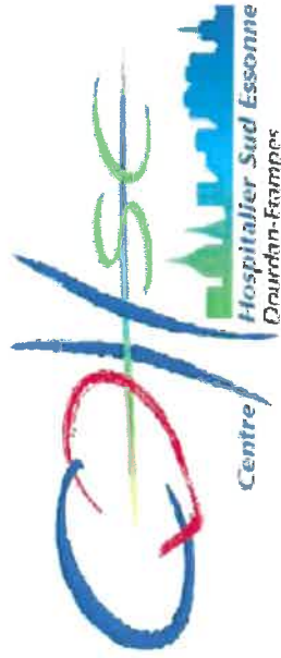
Schéma Directeur Immobilier Fin