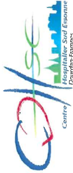
Schéma Directeur Immobilier Présentation

Le Centre Hospitalier Sud Essonne Dourdan-Etampes est issu de la fusion des Hôpitaux de Dourdan et d'Etampes.