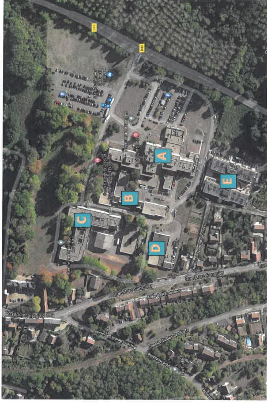
Schéma Directeur Immobilier État des lieux du Site d'Étampes