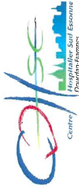
Schéma Directeur Immobilier Opérations de Travaux