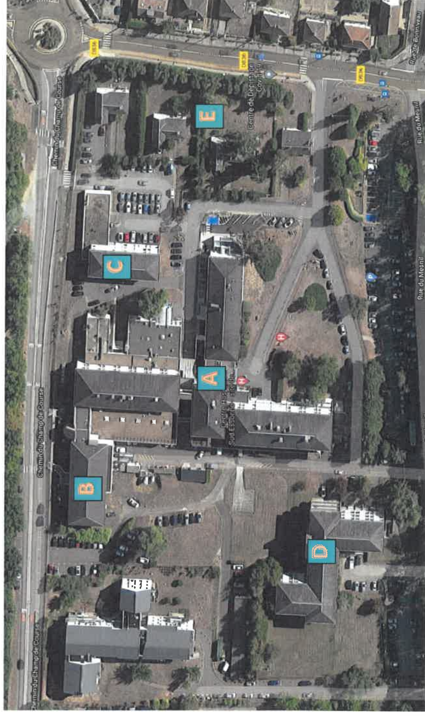
Schéma Directeur Immobilier État des lieux du Site de Dourdan